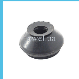
Пыльник рулевого наконечника M2141 Код: 1035050