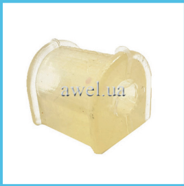
Втулка штанги стаб М 412 силикон Код: 1640150