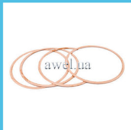
Р/к колец гильз М 412, 2140 Код: 457500