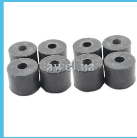
К-т втулок стабилизатора М412 завод Код: 994000