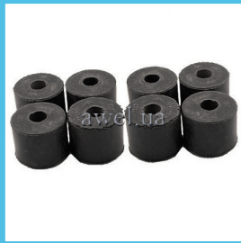
К-т втулок стабилизатора М412 Код: 995000