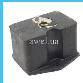
Подушка двигателя правая больш завод Код: 1305100