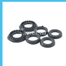
Р/к ГТЦ M 2140 завод/не завод Код: 415000/413000