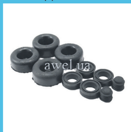
Р/к РТЦ M 2140,2141 Код: 419000