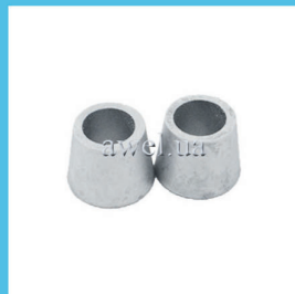
Р/к маятника М 412, 2140 Код: 463000