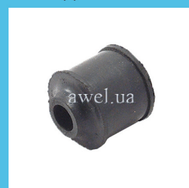
Втулка заднего амортизатора M2141 Код: 1663000