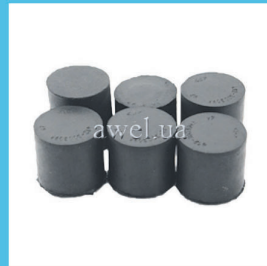
Р/к вкладышей рулев тяг М412 резиновые Код: 453000