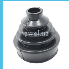
Пыльник привода п/о наружный Код: 1117000