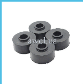
К-т втулок верхнего амортизатора М412 Код: 1000000