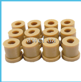
К-т втулок зад рессоры М412 молочный Код: 992120