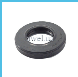
Сальник редуктора заднего моста Код: 81900