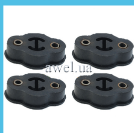
К-т подушек глушителя Код: 1346000