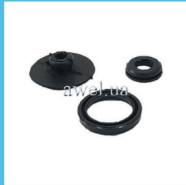
Р/к вакуумного усилителя М 2140 Код: 444000