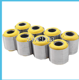
К-т сайлентблоков М412 полиуретан Код: 48601720