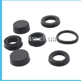
Манжеты D22 Москвич Код: 918000