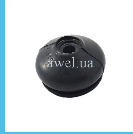
Пыльник рулевого наконечника резина Код: 1029100