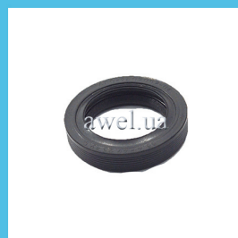
Сальник удлинителя наружный Код: 81600