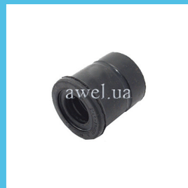
Отбойник перед амортизатора M2141 Код: 1623100