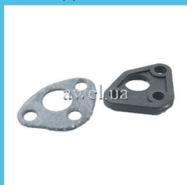
Р/к проставки бензо насоса М 412 Код: 470000