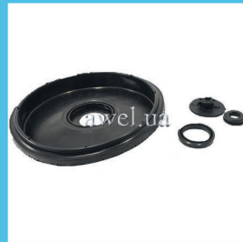
Р/к в/у полный М 2140 Код: 445000