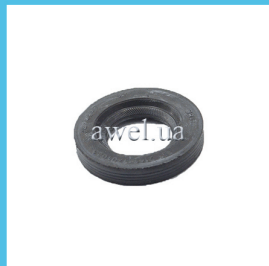
Сальник ведущего вала КПП M2141 24x42 Код: 83200