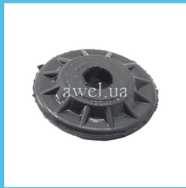
Втулка передней подвески ромашка Код: 1665200