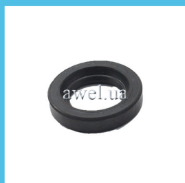
Сальник первичного вала КПП 29,8x50 Код: 81400