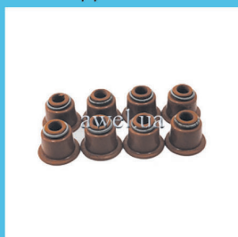
Р/к сальников клапанов М 412 Код: 475000