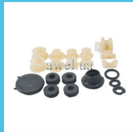
Р/к кулисы М412, 2140 Код: 1133000