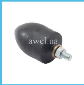
Отбойник нижний М 412 завод Код: 1619005