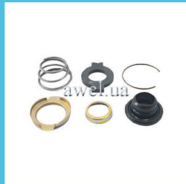
Р/к водяной помпы М 412, 2140 Код: 447000