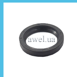
Сальник полуоси заднего моста Код: 81700