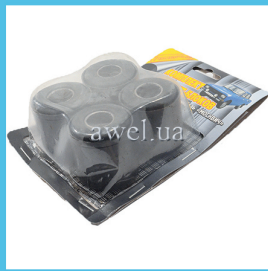
К-т сайлентблоков нижних М412 усил Код: 48601870