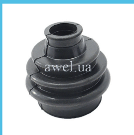
Пыльник привода п/о внутренний Код: 1114100