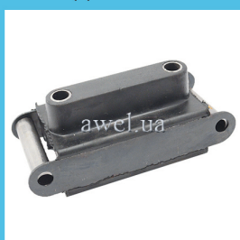
Подушка коробки Москвич Код: 1340000