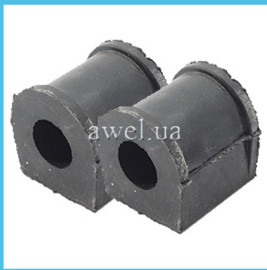
К-т втулок штанги стабилизатора М2140 Код: 999000