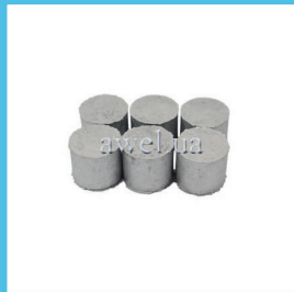
Р/к вкладышей с графитом М412 Код: 454000