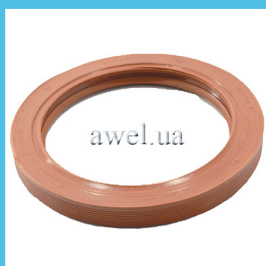
Сальник коленвала задний 80x105 кр Код: 82200