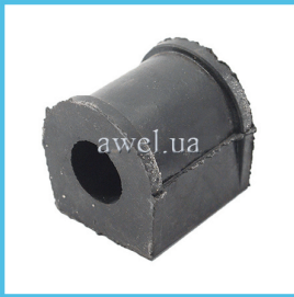
Втулка штанги стабилизатора М2140 Код: 1641000