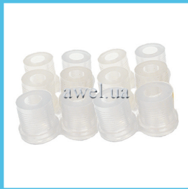
К-т втулок задней рессоры М412 силикон Код: 2646100