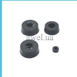
Р/к вакуумного усилителя М 412 Код: 442000