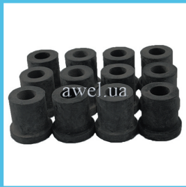
К-т втулок задней рессоры М412 Код: 992000