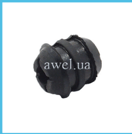
Втулка соединительная бачка ГТЦ Код: 1641200