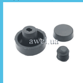
Р/к РТЦ M 412, 2140 Код: 435000