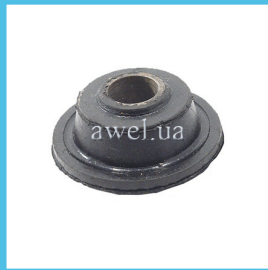
Втулка передней подвески грибок Код: 1665300