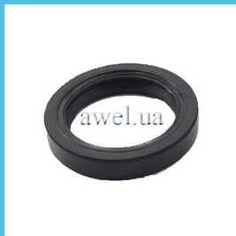
Сальник полуоси M2141 41x56 Код: 83100

Вы думаете только о дороге, остальное - наша забота МОСКВИЧ