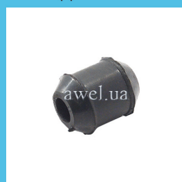
Сайлентблок зад рычага M2141 Код: 1661100