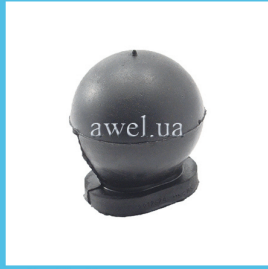
Отбойник заднего моста M 412 Код: 1624000