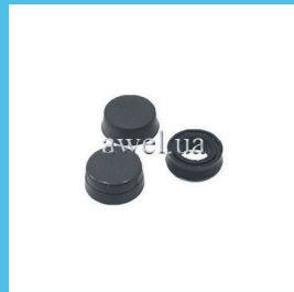
Р/к РигЦС набор манжет М 412 Код: 441000