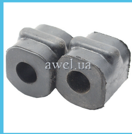
К-т втулок штанги стабилизатора М2141 Код: 1000500