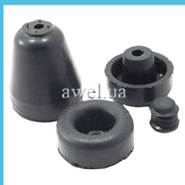
Пыльники рабочих и главных цилиндров Код: 1171000