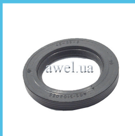
Сальник ступицы переднего колеса Код: 81800