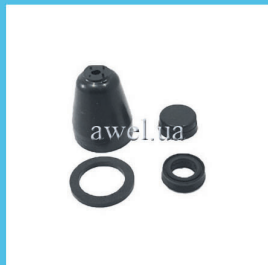
Р/к ГЦС М, ГАЗ, УАЗ завод/не завод Код: 43800/437000