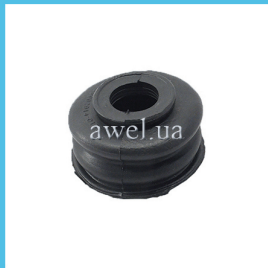
Пыльник ш/о низ M 412 Код: 1039200