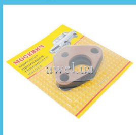
Р/к проставки б/н М 412 blister Код: 471000