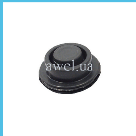
Пыльник вилки сцепления Код: 1107000