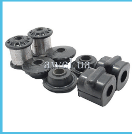
К-т втулок передней подвески М2141 Код: 1001000