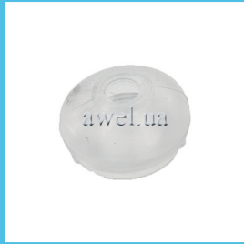
Пыльник рулевого наконечника силикон Код: 1029310