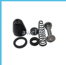
Р/к ГЦС с поршнем М 412, ГАЗ Код: 439000