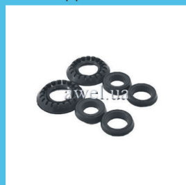
Р/к ГЦС М 2141 Код: 478000