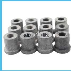
К-т втулок зад рессоры М412 завод Код: 991000