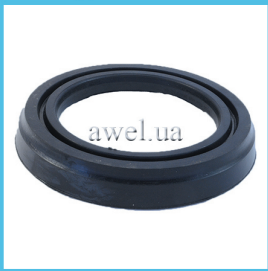
Проставка под переднюю пружину Код: 592000