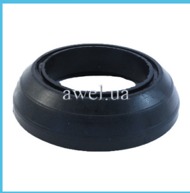
Проставка под перед пружину усиленная Код: 593000