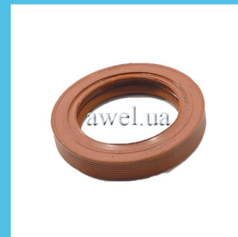
Сальник коленвала передний 42x62 кр Код: 82100