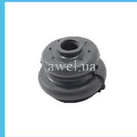
Пыльник ш/о верх M 412 Код: 1029500