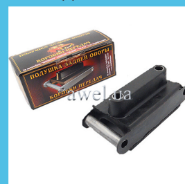
Подушка коробки в упаковке Код: 1339000