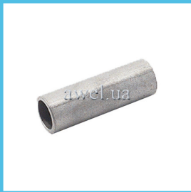
Металл втулки зад амортизатора Код: 456000