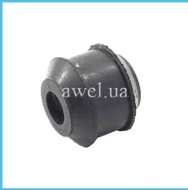
Втулка рулевой рейки М 2141 Код: 1665000