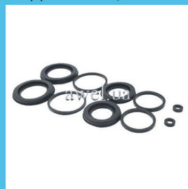
Р/к суппорта переднего M412,2140 Код: 423000