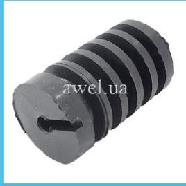
Отбойник заднего амортизатора M2141 Код: 1623110