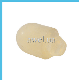
Отбойник верхний M412 силикон Код: 1622050