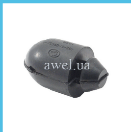
Отбойник верхний M 412 Код: 1622000