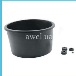
Р/к в/у полный М 412 Код: 443000