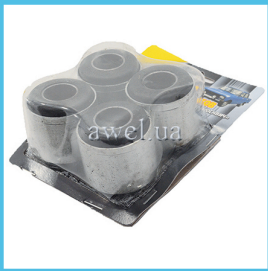
К-т сайлентблоков верх М412 усиленные Код: 48601850