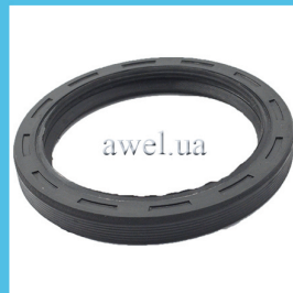
Сальник коленвала задний 80x105 Код: 81300