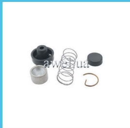
Р/к РЦС с поршнем М 412, 2140 Код: 436000