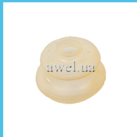
Пыльник ш/о верх M412 силикон Код: 1039100