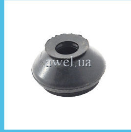
Пыльник рулевого наконечника Волжск Код: 1029000