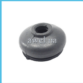
Пыльник рулевого наконечника ПВХ Код: 1029110