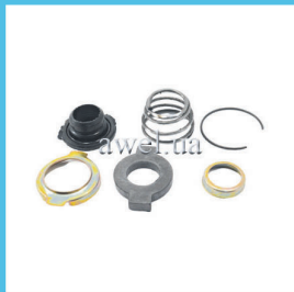
Р/к водяной помпы завод/не завод Код: 447100