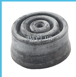
Пыльник рычага КПП салон Код: 1133000