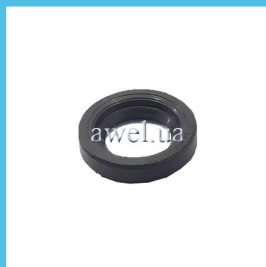
Сальник вала рулевой сошки Код: 82000