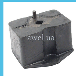
Подушка двигателя правая большая Код: 1305150