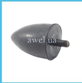
Отбойник нижний М 412 Код: 1619000