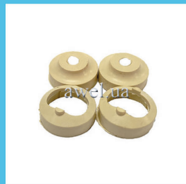
Р/к верхней ш/о М 412, 2140 Код: 468000