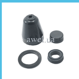
Р/к ГТЦ M 408 Код: 411000