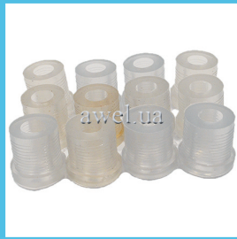
К-т втулок задней рессоры М412 прозрач Код: 992110