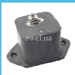
Подушка двигателя левая мал завод Код: 1306100