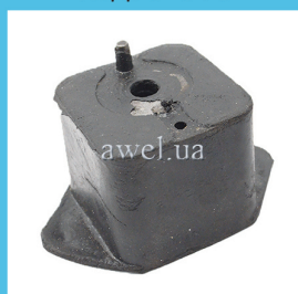
Подушка двигателя левая малая Код: 1306150