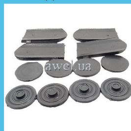
Р/к противоскрипов М 412, 2140 Код: 447150