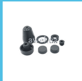
Р/к РЦС и ГЦС М 412, 2140 Код: 440000