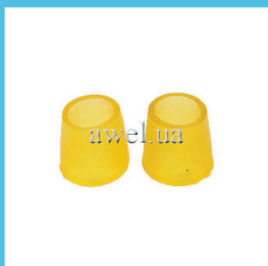
Р/к маятника М412, 2140 силикон Код: 464000