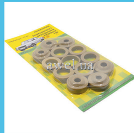
Р/к вкладышей рул тяг М 412 blister Код: 452000