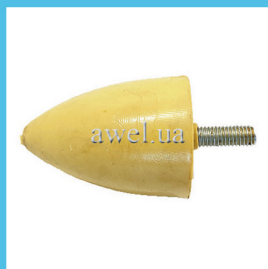
Отбойник нижний M412 полиуретан Код: 1621050