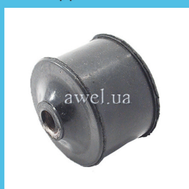
Втулка задней балки M 2141 Код: 1661000