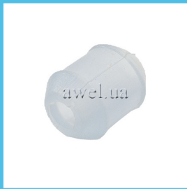
Втулка силикон зад амортизатора Код: 1664050