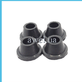
Р/к втулок балки М 412, 2140 Код: 450100