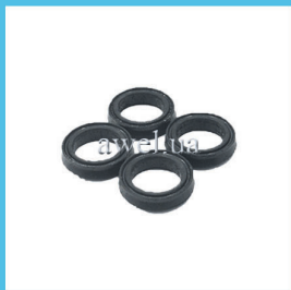
Р/к манжет D 24 М 412 Код: 467000