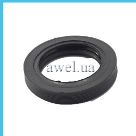
Сальник коленвала передний 42x62 Код: 81100