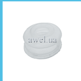
Пыльник ш/о низ M412 силикон Код: 1072000