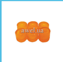
Р/к вкладышей силикон М 412 Код: 455000