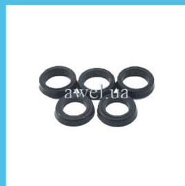
Р/к ГТЦ M 412 завод/ не завод Код: 414000/412000