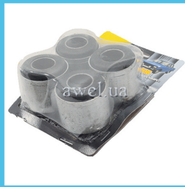
К-т сайлентблоков верхних М412 Код: 48601840