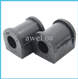
К-т втулок штанги стабилизатора М412 Код: 997000