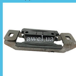
Подушка коробки M 2141 Код: 1338000