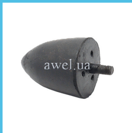
Отбойник нижний M412 усиленный Код: 1619050