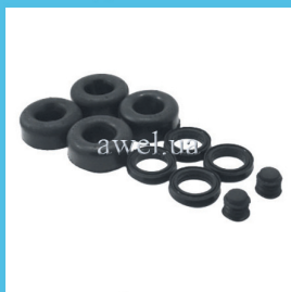
Р/к РТЦ M 408,412 Код: 418000