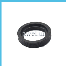
Сальник удлинителя внутренний Код: 81500