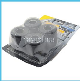
К-т сайлентблоков нижних М412 Код: 48601860