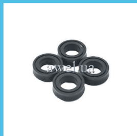
Р/к манжет D 22 М 2140 Код: 466000