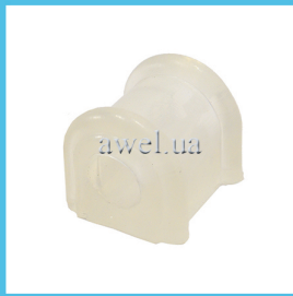
Втулка штанги стаб ОДА силикон Код: 48680863