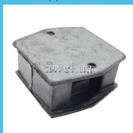
Подушка двигателя M 2141 Код: 1307000