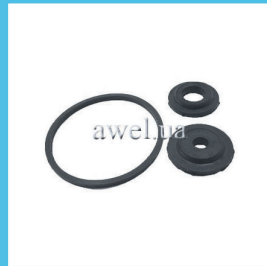
Р/к масляного фильтра М 412, 2140 Код: 446000