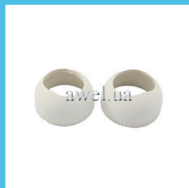
Р/к нижней ш/о М 412, 2140 Код: 469000